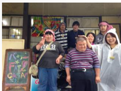
教会バザー初参加