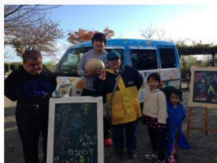
カーペイントデビュー